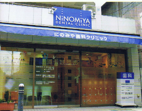
住宅地の商店街に面した医院。