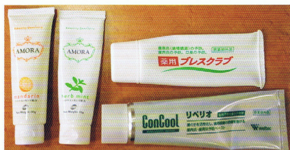
上/口腔内マッサージに使っている『AMORA』(オーラルケア)、『リベリオ』(ウエルテック)、『プレスクラブ』(シンクタンク)。患者さんの好みに合わせて使い分けている。オーラルケアと宝田恭子先生主催のセミナーを受け、両方から学んだことを取り入れている。