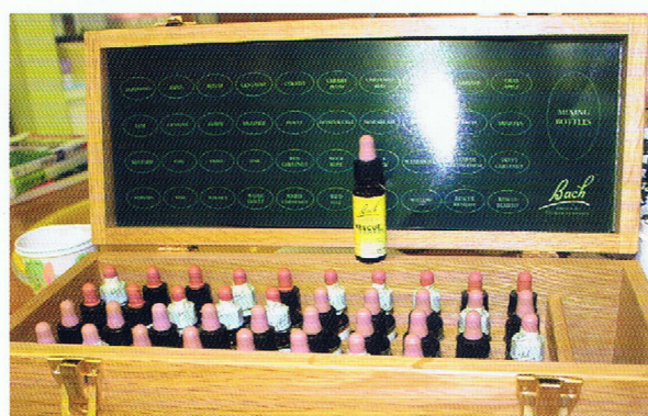
「パッチフラワー」と呼ばれる、花のバイブレーションが入ったエッセンス。エッセンスを垂らした水を飲むと、歯科恐怖症の患者さんも表情が和らぐという。

かれている状態を知ること、原因を探ります。いわゆる「ナラティブ・ペイスト・メディスン」と呼ばれる考え方は、