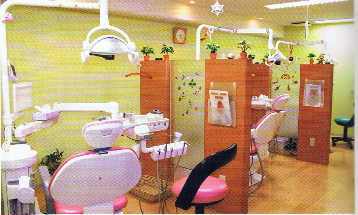
診療室。天井から下がっている飾りは、診療中に患者さんの気持ちを和らげるための工夫。